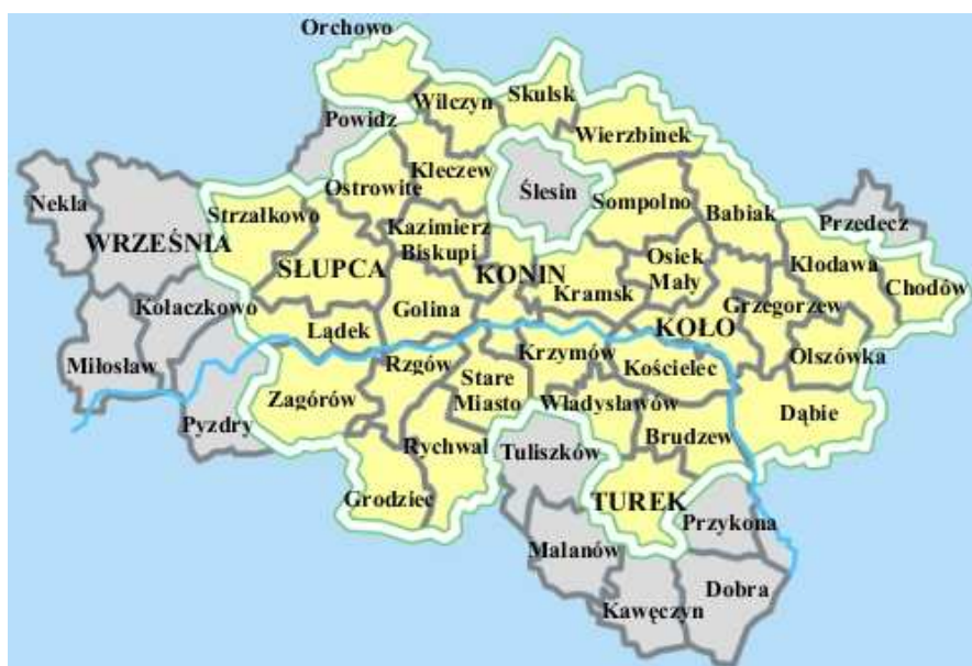
Mapa 1 Gminy biorące udział w przedsięwzięciu pt. "Uporządkowanie Gospodarki Odpadami Na Terenie Subregionu Konińskiego"

Realizacja projektu ma doprowadzić do właściwej gospodarki odpadami, zgodnie z wymogami prawa polskiego i unijnymi, które zobowiązują miasta i gminy do zagospodarowania odpadów selektywnie gromadzonych (także odpadów niebezpiecznych) oraz segregowania i składowania odpadów zmieszanych odbieranych od przewoźników lokalnych. Docelowo inwestycja pozwoli na zmniejszenie ilości surowców wtórnych na składowiskach, wydłużenie żywotności składowisk i maksymalnie ograniczy negatywne skutki oddziaływania na środowisko - zanieczyszczenie wód gruntowych czy emisję do atmosfery uciążliwych związków zapachowych.