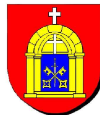
GMINA STARE MIASTO