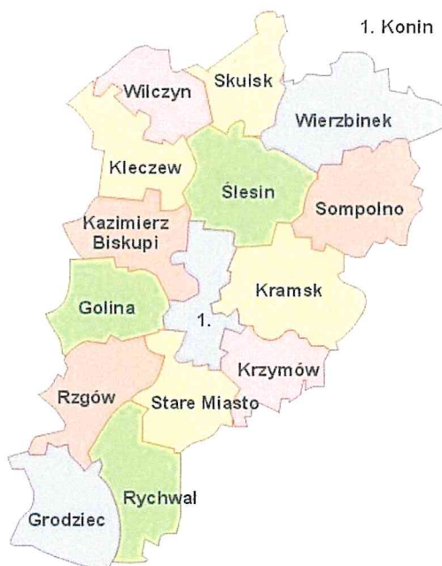
Rysunek 1. Gmina Stare Miasto na tle powiatu konińskiego.

Gmina Stare Miasto położona jest w województwie wielkopolskim. Oddalona jest od Konina o około 8 km oraz od Kalisza o około 50 km, dlatego też pozostaje w obszarze bezpośrednich wpływów obu miast (społecznych, ekonomicznych, rekreacyjnych i infrastrukturalnych). W skład Gminy wchodzi 16 sołectw, zaś terytorium obejmuje obszar 97,82 km 2 .