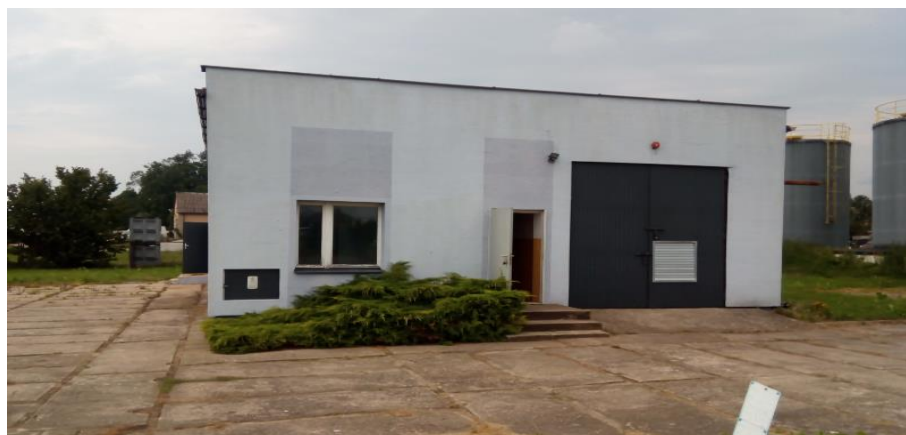
Rys. 1. Hydrofornia w Żychlinie

Obszar na którym planowane jest posadowienie instalacji stanowi grunt dookoła budynku hydroforni.