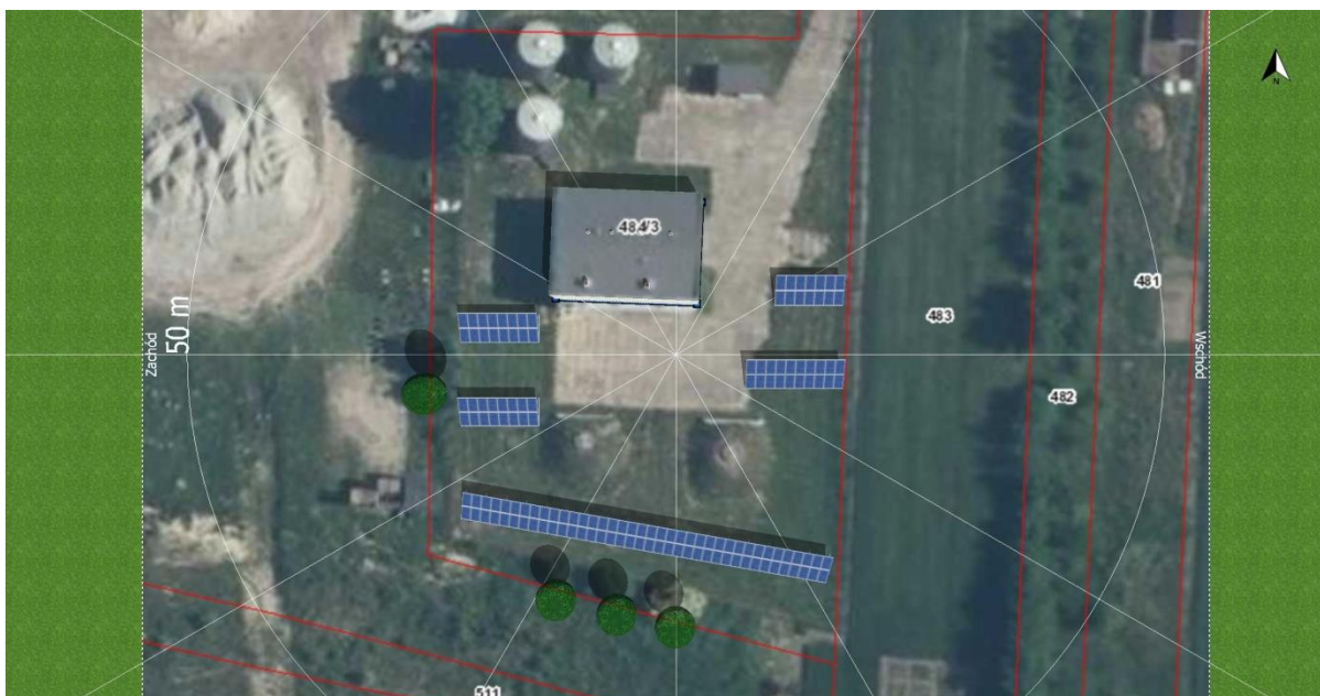
Rys. 4. Wizualizacja modułów na gruncie

Na wstępnym rozplanowaniu instalacja składa się ze 142 modułów.