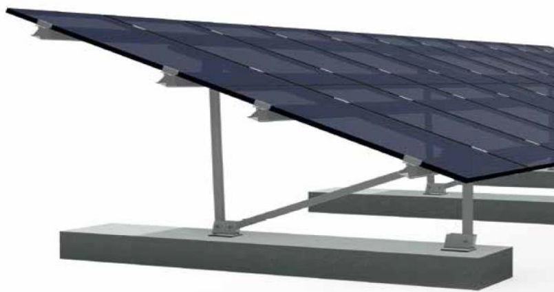
Rys. 6. Ilustracja przykładowego systemu montażowego.

Zastosowana specjalna powłoka metaliczna zapewnia długotrwałą ochronę powierzchni przed korozją.