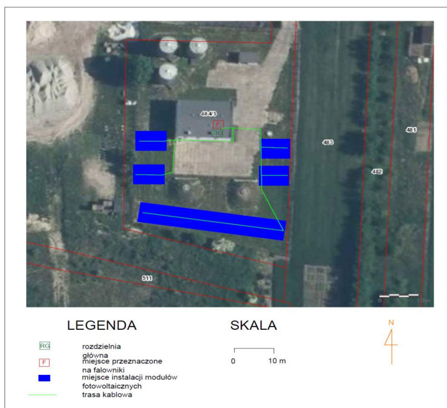
Rys. 5. Lokalizacja falownika, rozdzielni głównej oraz przebieg trasy kablowej

Instalacja zostanie przyłączona do rozdzielni głównej budynku znajdującej się w budynku w pomieszczeniu socjalnym. Punkty przyłączenia mikroinstalacji oraz trasy kablowe zostały przedstawione na poniższym rysunku.