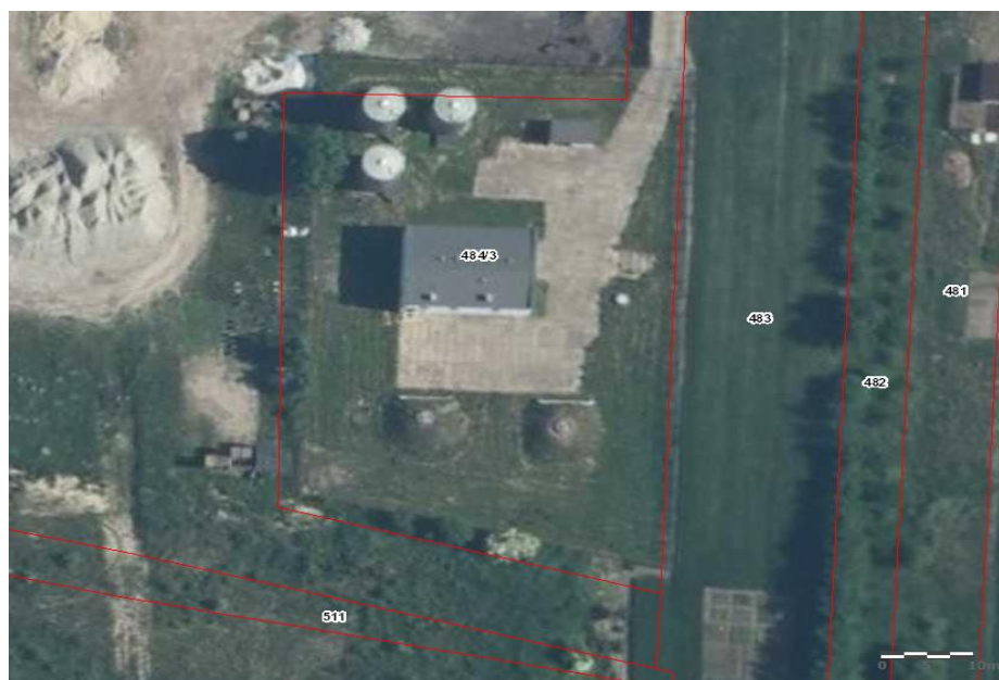
Rys. 2. Lokalizacja instalacji na gruncie

Poniższy rysunek przedstawia umiejscowienie instalacji na mapie.